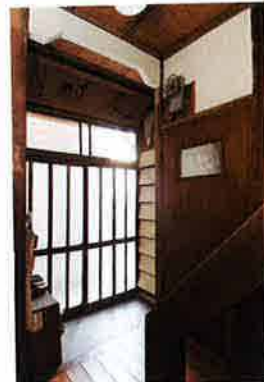
左・2階天井。THE 土壁木造家屋!の風情が住まい手の心の琴線に触れる 右・階段。手摺りと壁との接合部には葉っぱをモチーフにした模様が