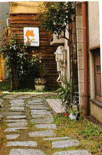
パウハウス高円寺は、杉並区の住宅密集地に建つ再建築不可物件。最寄駅から徒歩1分の好立地で、かつ緑豊かな