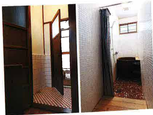
左・2階トイレ。トイレは各階1つずつ。鍵は以前のままのかんぬき式 右・バスは五右衛門風呂を彷彿させる丸型。高窓からの光が美しい