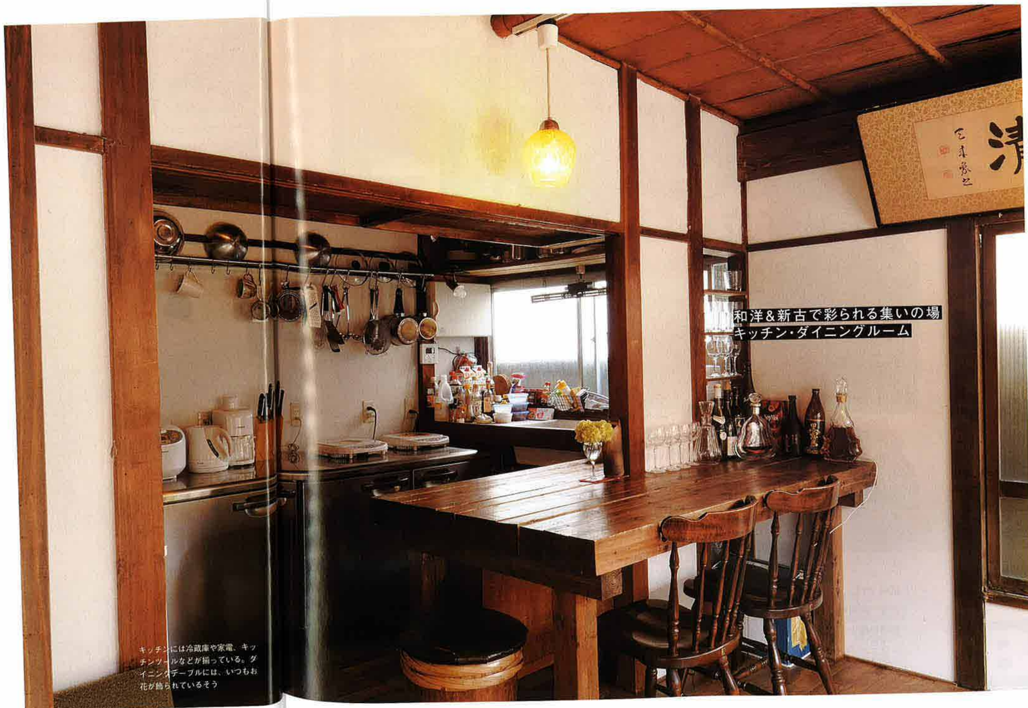
キッチンには冷蔵庫や家電、キッチンツールなどが揃っている。ダイニングテーブルには、いつもお花が飾られているそう

ふれるLDK、8つの個室を有するゲストハウスとして蘇ったのだった。そして、ゲストハウス専門の検索エンジン「ひつじ不動産」に掲載されるとすぐに、入居希望者が殺到。オープンして約2年、大関社長の面接に通った8名が、入れ替わりながら、ひとつ屋根の下暮らししている。ゲストハウスとは?