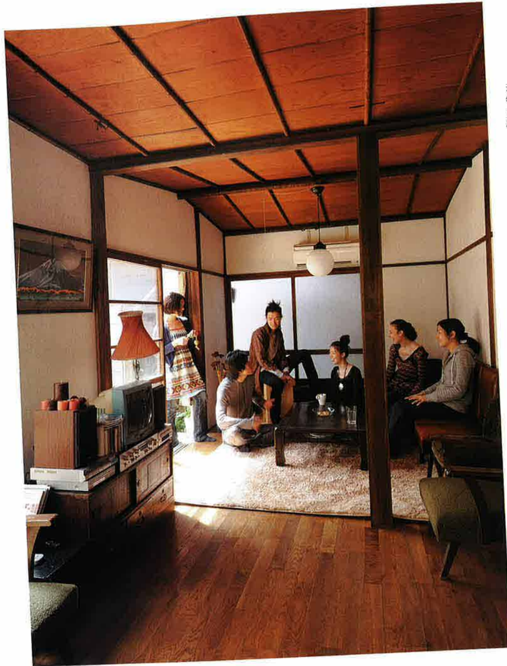
元々は下宿として使われていた建物を、ゲストハウスにリノベーション。1階のテラスに面した2部屋を繋げて、リビングルームに